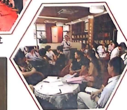
获评海沧区“彩虹桥”优秀家校读书共同体