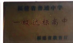
获评省一级达标高中