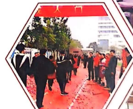
高三学子走过“成人门”