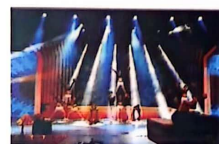
舞蹈队亮相全市舞台