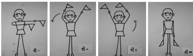
一位大班幼儿绘制的“红旗操”示意图