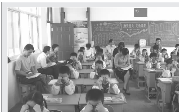
首次课堂观察活动