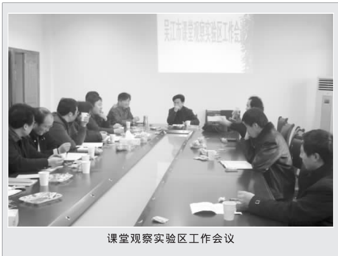
课堂观察实验区工作会议

4. 重建教研文化。课堂观察必将改善我们的教研文化。首先,让我们的思维方式由惰性走向探究。日复一日的教学如果是一种缺乏新鲜感的行为,必将让教师感觉厌倦,必将让教师在厌倦