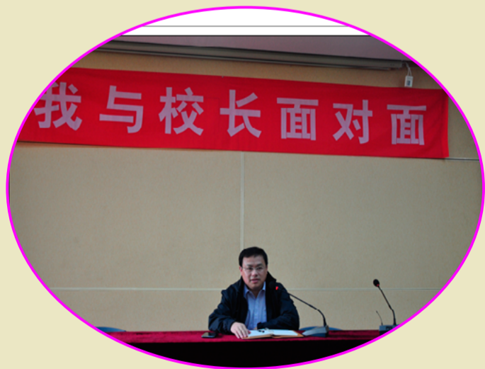
校领导与学生面对面——后勤专场

为倾听广大学生的意见和建议，3月31日校团委组织举办了“我与校长面对面”后勤专场活动，让广大学生与学校后勤管理层直接对话。同学们对食堂、宿舍、商店、体育锻炼时间、社团活动、体育设施等提出了自己的疑虑和建议。这样活动的开展有利于我们领导干部深入群众，提升学校的办学质量和后勤服务水平，全心全意为学生着想，