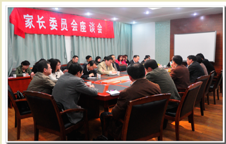
校领导与家长面对面专场

4月3日下午，校党委、校长室，组织召开了高一学生“家长委员会”会议。座谈会上，家长们就孩子成长中的困惑与疑虑，诉说自己的思考并寻求学校的指点和帮助。学校领导就亲子沟通、“高考方案”、“智商与情商”、“学业与技能”、“学习方法”、“导师制”“同伴互助学习”、“孩子偏科的分类指导”、“拓宽家校互动渠