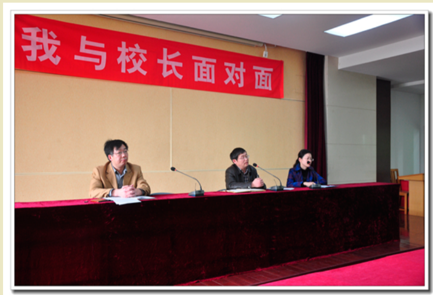
校领导与学生面对面——教学专场

中国共产党发展壮大的历史，是一部依靠群众、发动群众、服务的生动历史。只有始终坚持为人民服务的根本宗旨，党才得到最广大人民群众的真挚拥护。因此，群众路线是我们党的根本路线，也是一切工作的出发点。