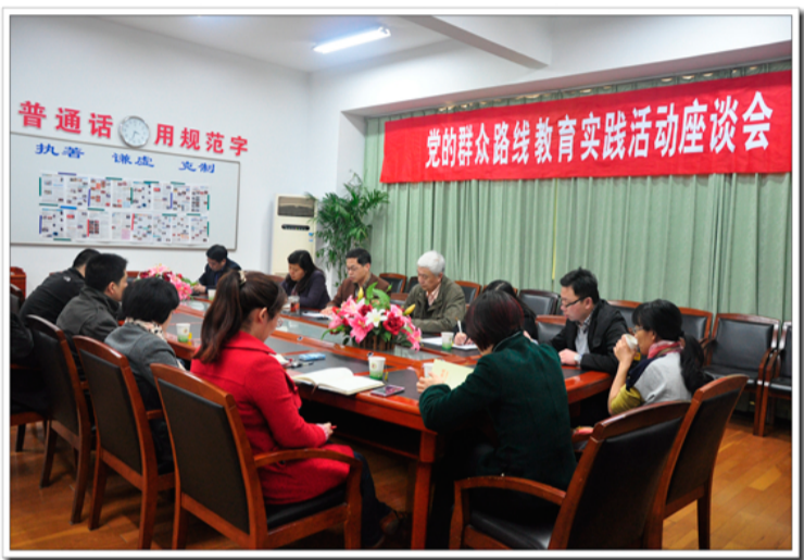
校领导与教师面对面专场