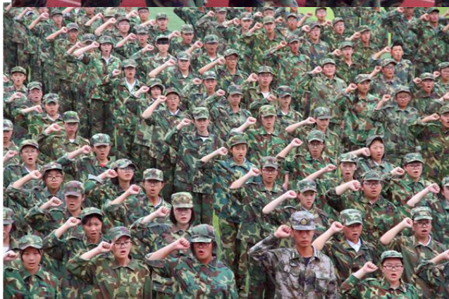
勤劳动表达了最诚挚的敬意和最衷心的感谢，对参与军训工作的各位老师表达了深深的谢意，对全体军训学员表示了热烈的祝贺。她希望通过军训，全体高一新同学将严明的纪律带回去，将优良的风气带回去，将良好的习惯带回去。