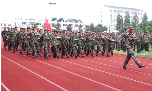
集体一等奖：一连、十三连；二等奖：五连、八连；