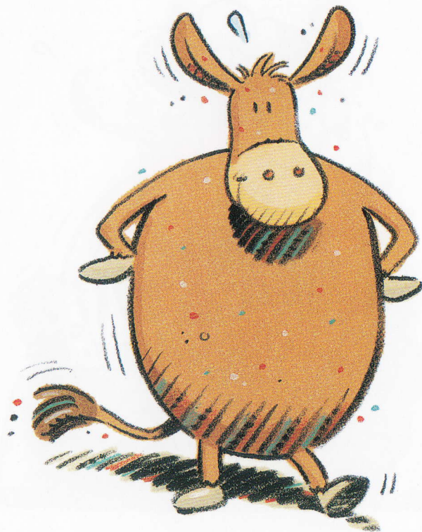
The huge mule.