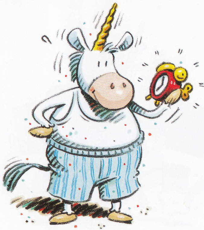
The plump unicorn.