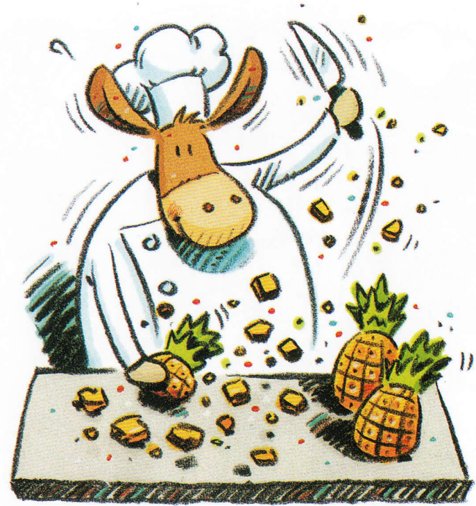
The huge mule cubes the fruit.