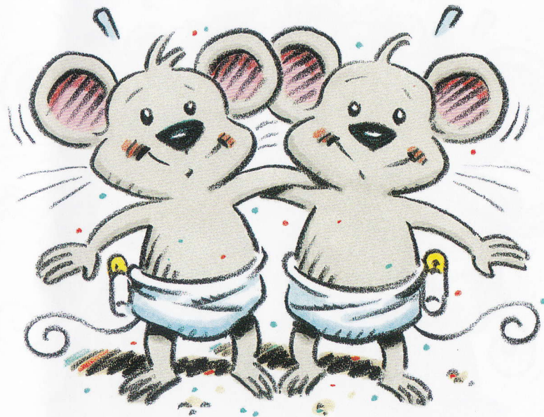
The twin mice.