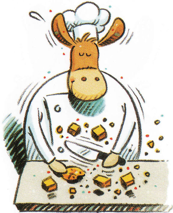
The huge mule cubes.