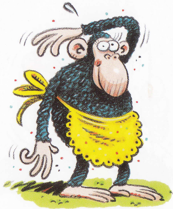
The black ape.