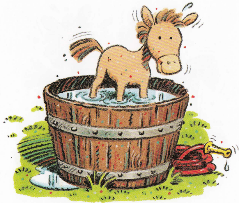
The foal soaked.