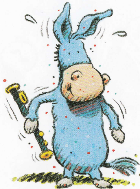
The blue mule.