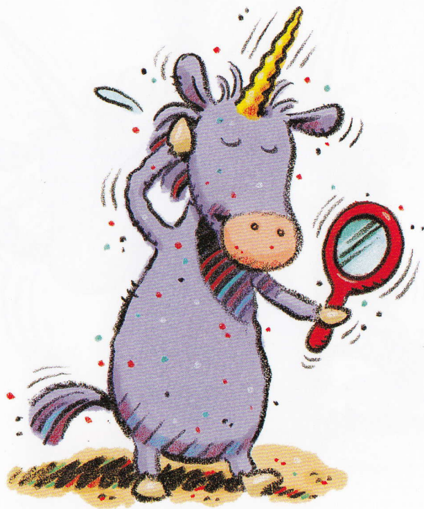
The cute unicorn.