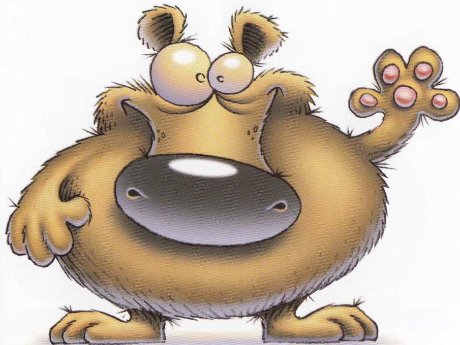
The big cub.