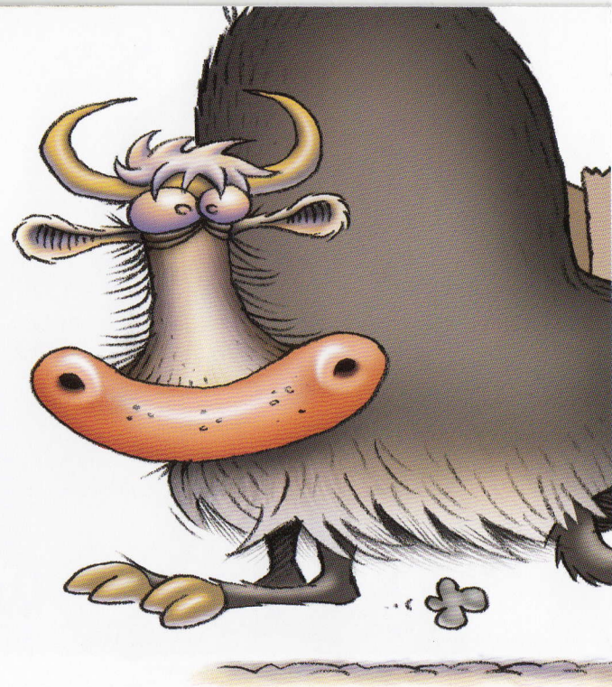
The yak ran.