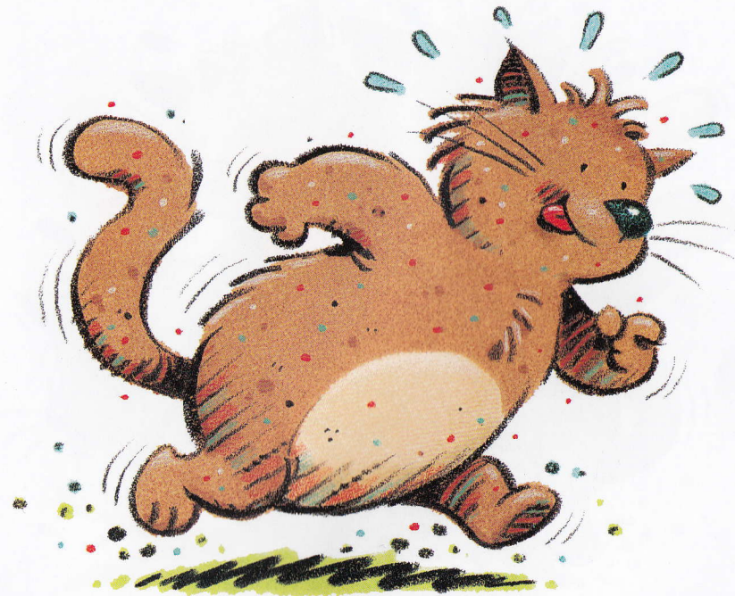
A tan fat cat ran.