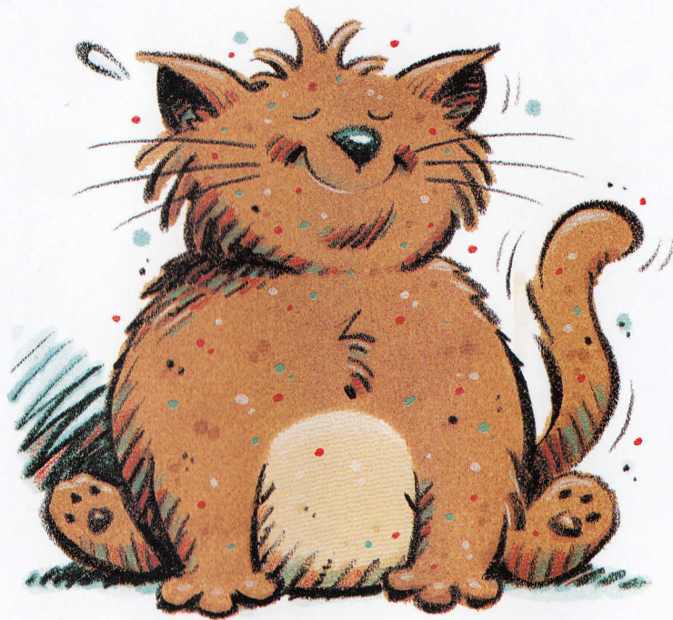
A tan cat.