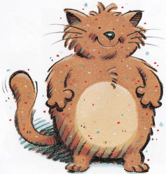
A tan fat cat.