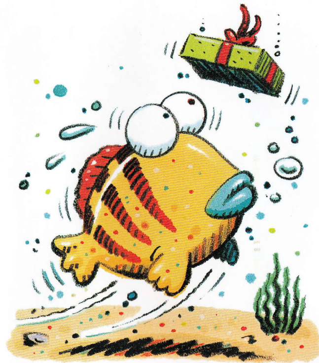
The fish lifts.