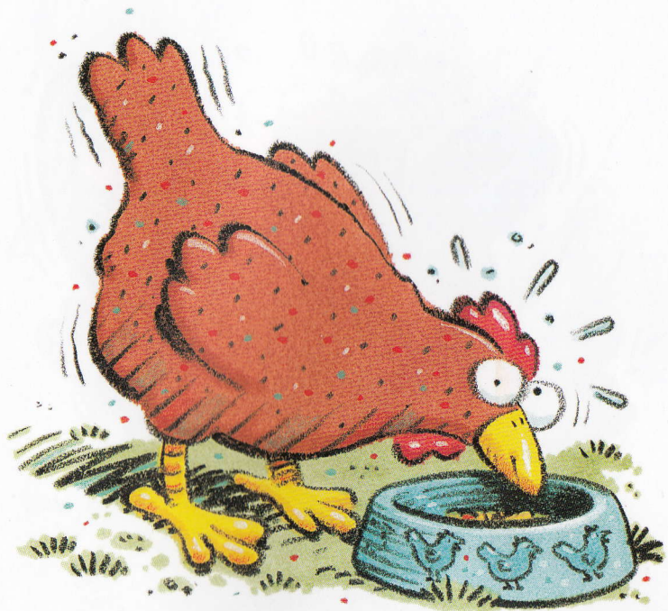
A pet hen.