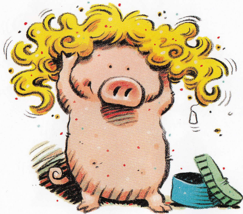
A pig and a wig.