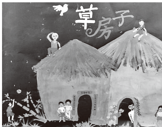
高年段《草房子》邮票

精彩的分享。男生、女生的兴趣不同，读一本书也会有不同的感受，男、女生之间的分享有助于共同成长，互相欣赏，互相学习。